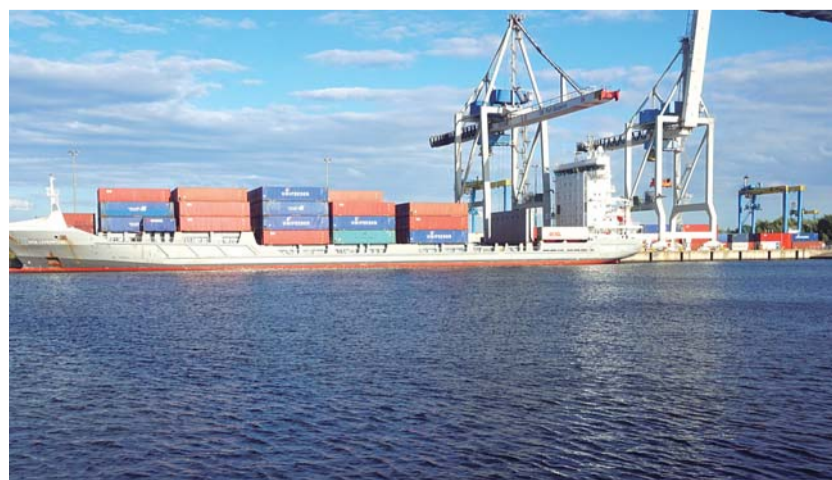
Ten rok powinien zamknąć się wielkością przekraczającą 26 mln t

Dobry początek roku portów w Szczecinie i Świnoujściu