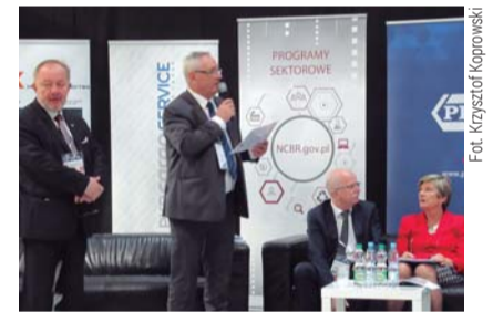
Część panelowa konferencji

Spotkanie składało się z dwóch części. Pierwsza poświęcona była perspektywom Centralnego Portu Komunikacyjnego, druga (debata panelowa) – wpływom poszczególnych gałęzi transportu na rozwój przewozów intermodalnych.